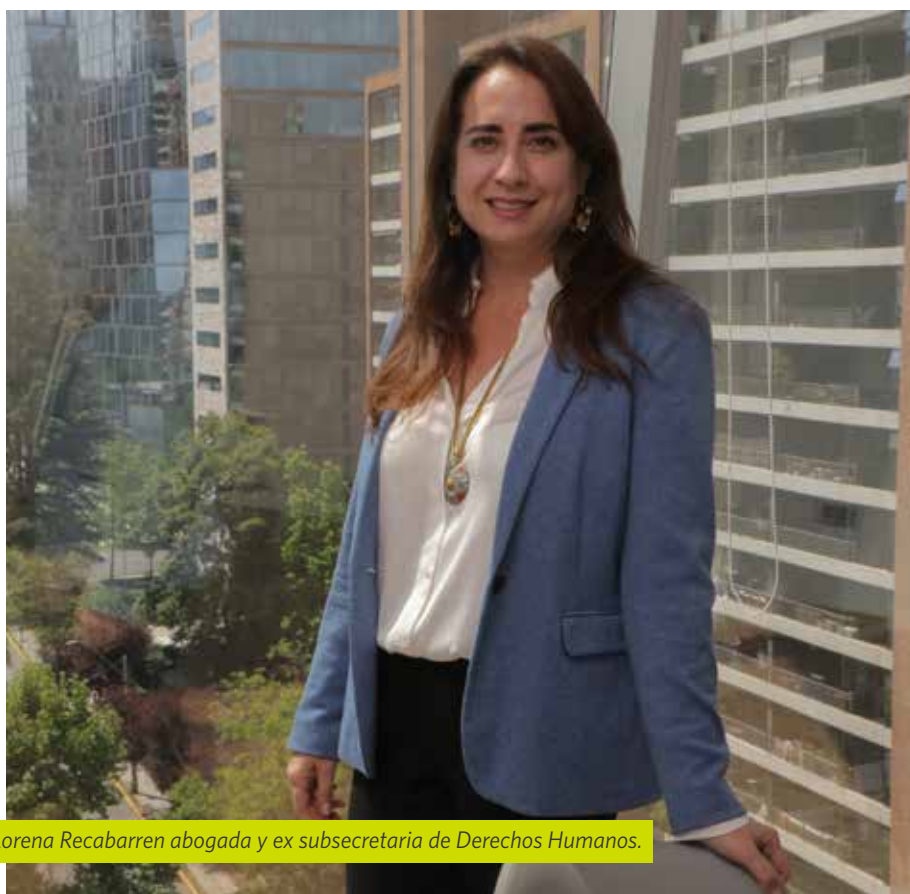
Lorena Recabarren abogada y ex subsecretaria de Derechos Humanos.

>> El próximo año se espera que el Gobierno presente un proyecto de ley de debida diligencia corporativa vinculante en materia de derechos humanos.